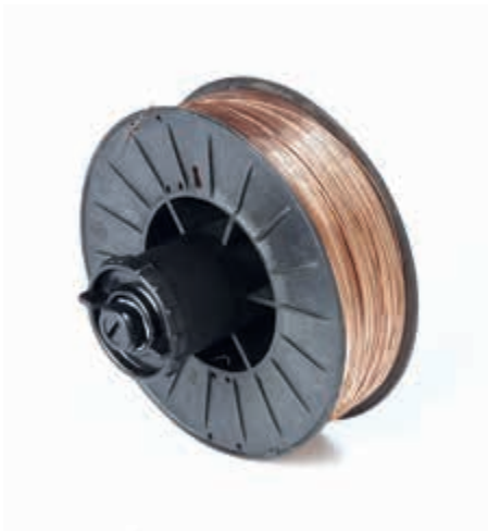
S602116 TG10 + S604

Внимание: S602-116 TG10 используется только с пластиковыми катушками со следующими характеристиками: Внутреннее отверстие: \varnothing 53 мм. Ширина: 100 мм.